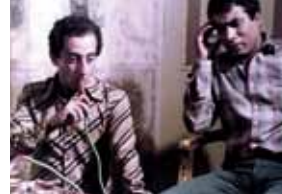
L'Amour aux pieds des pyramides