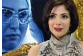
Femmes du Caire