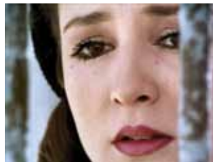
Alexandrie pourquoi ?