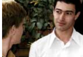
Alexandrie pourquoi ?