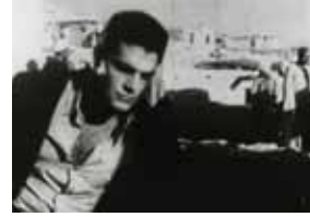
Les Eaux noires