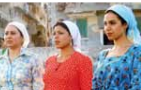
Femmes du Caire

La rétrospective Ciné-Égyptomania, du 13 juin au 5 août 2012, offre une plongée au cœur de l'Égypte du XX e et du début du XXI e siècle, à travers une cinquantaine de films représentatifs de différentes époques, genres et styles.