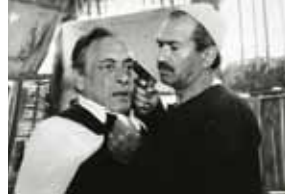
Mort parmi les vivants